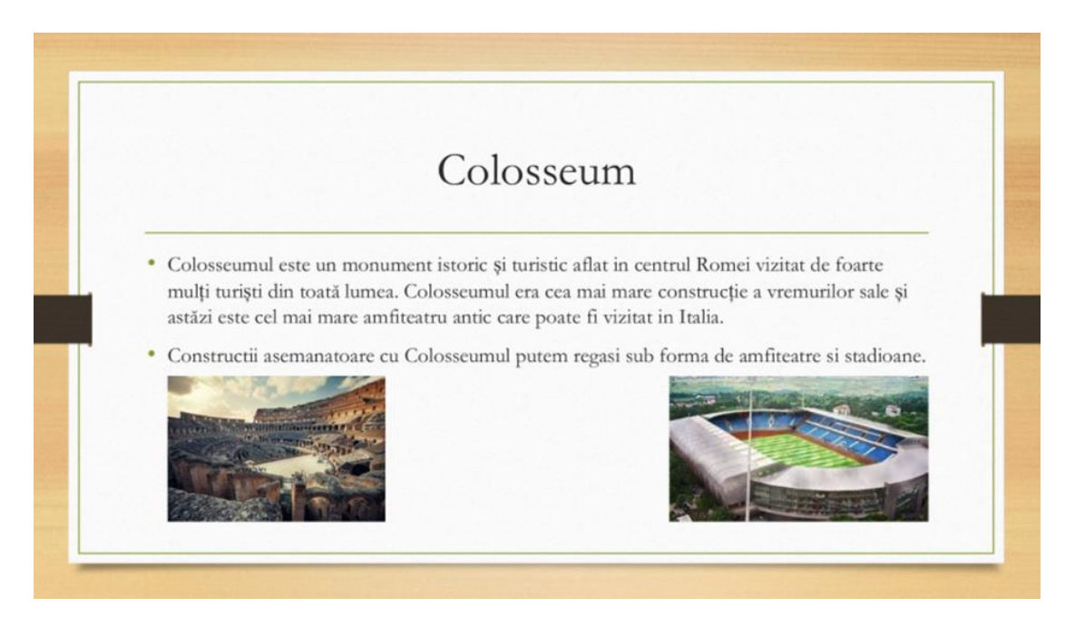
The Colosseum and the National Arena (football stadium).