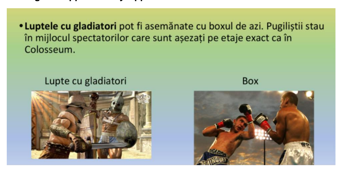
Gladiators' fights are similar with contact sports, like boxing.