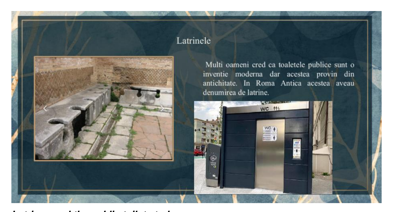
Latrines and the public toilets today

The Roman numbers that are used today to number chapters, to number the hours on watches, and in events name like World War II etc.